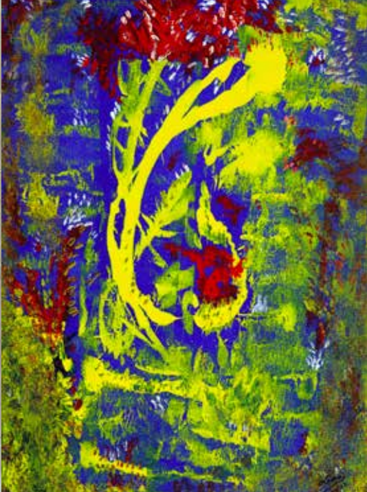
UMBELINA RIBEIRO FIM DE TARDE acrílico s/ tela, 2022 400€