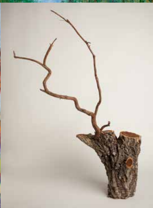
MIRIAM BIENCARD MINOCERDO madeira, 2021 250€