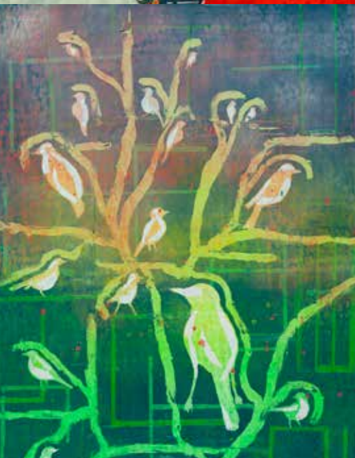
ANTÓNIO VAZ PÁSSAROS técnica mista s/ tela, s/ data 600€