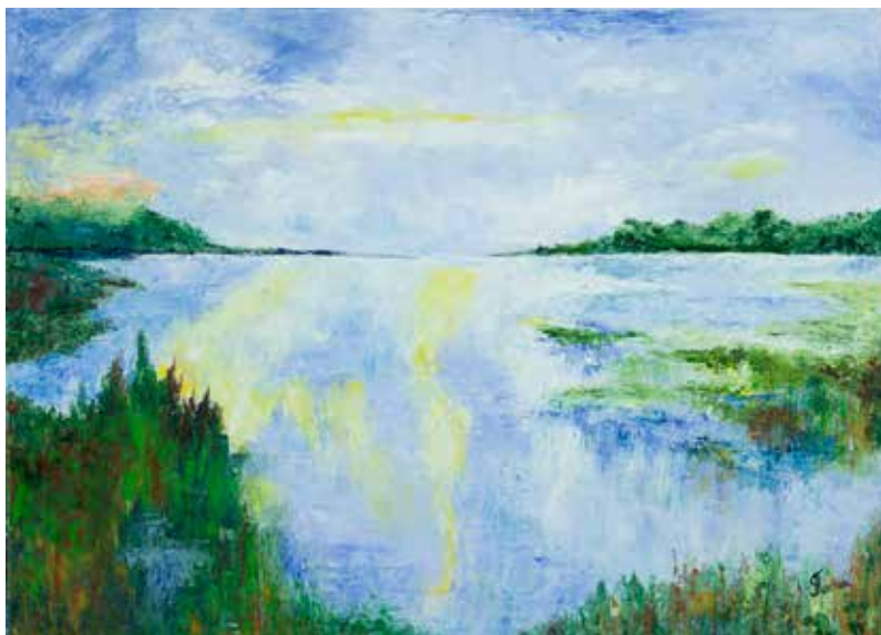
TERESA FUSCHINI S/ TÍTULO óleo s/ tela, s/ data 300€