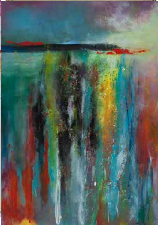
FILOMENA MORIM S/ TÍTULO acrílico s/ tela, 2009 600€