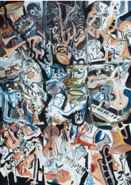
EDUARDO PALAIO ORQUESTRA EXECUTA REQUIEM PARA UMA EX-CIDADE acrílico s/ tela, s/ data 800€