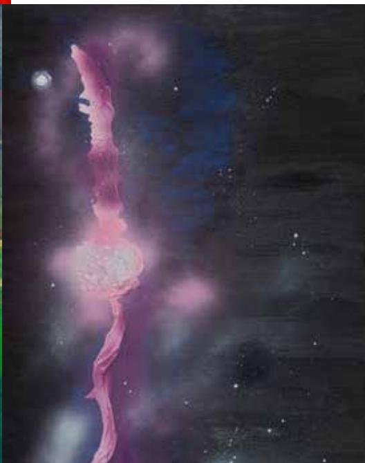
SUZETE REGO S/ TÍTULO acrílico s/ tela, s/ data 300€