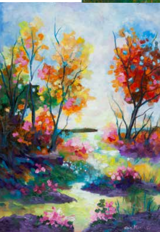
ANA MARIA GODINHO TRILHOS DA NATUREZA óleo s/ tela, 2022 290€