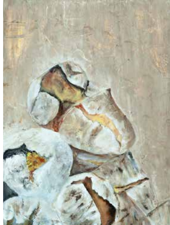
VITALINA SANTOS QUENTES E BOAS acrílico s/ tela, 2022 300€