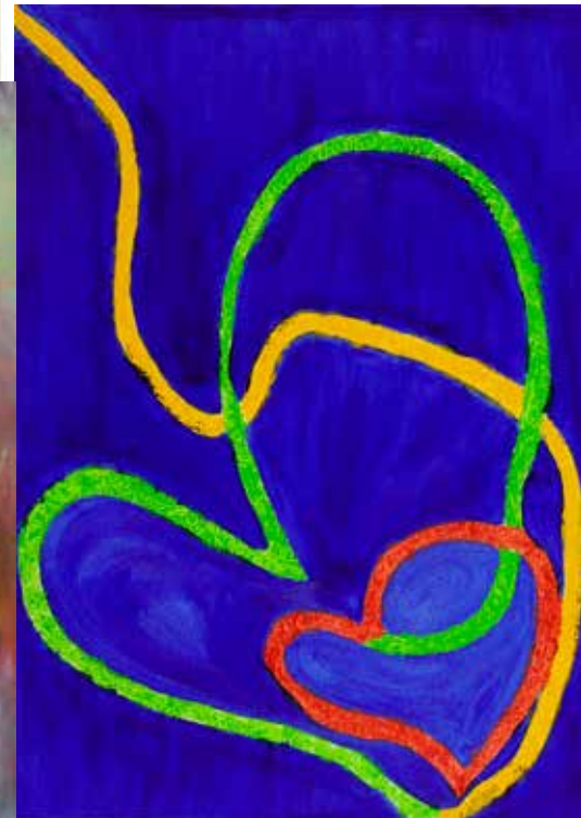
ANTÓNIA LAVINHA GAMBIARRA DE AMOR!! acrílico s/ tela, 2022 300€