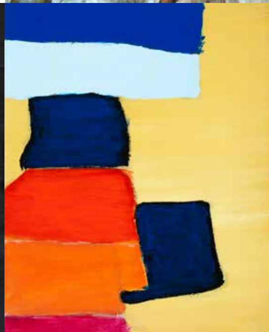
JOSÉ FRANCO S/ TÍTULO acrílico s/ tela, 2022 200€