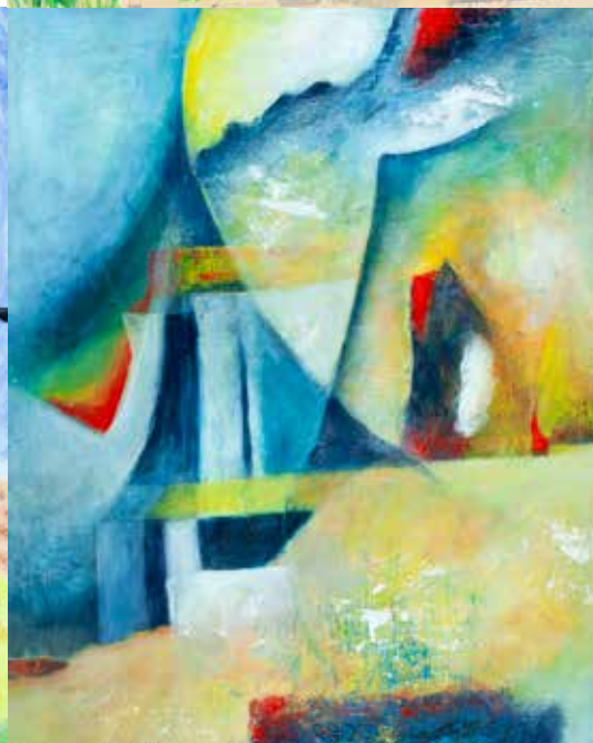
BELA MESTRE S/ TÍTULO técnica mista s/ tela, 2022 500€