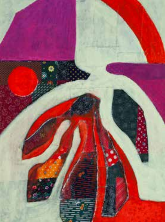
FRANCISCO CONDESSA S/ TÍTULO técnica mista s/ tela, s/ data 200€