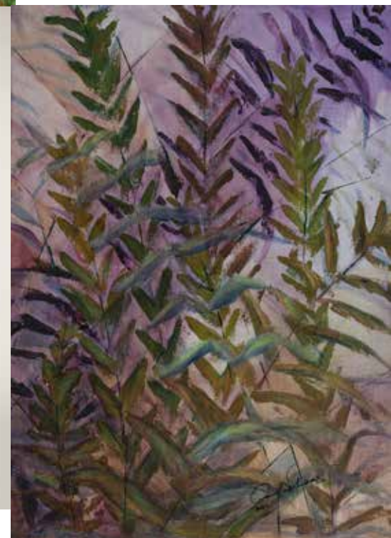
AMÉLIA VINHEIRAS VENTO NUMA TARDE DE VERÃO acrílico s/ tela, 2021 350€