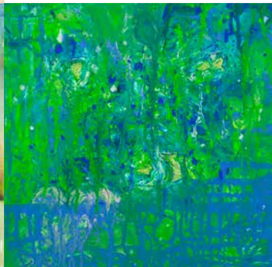
MARIA DE JESUS GRAÇA S/ TÍTULO técnica mista s/ tela, 2018 500€