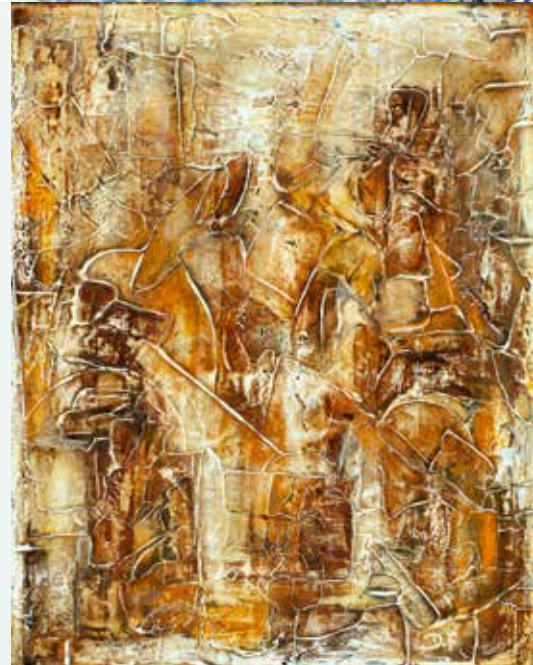
MARIA ANTONIETA FIGUEIREDO PAISAGENS DA MEMÓRIA XX técnica mista s/ tela, 2022 600€