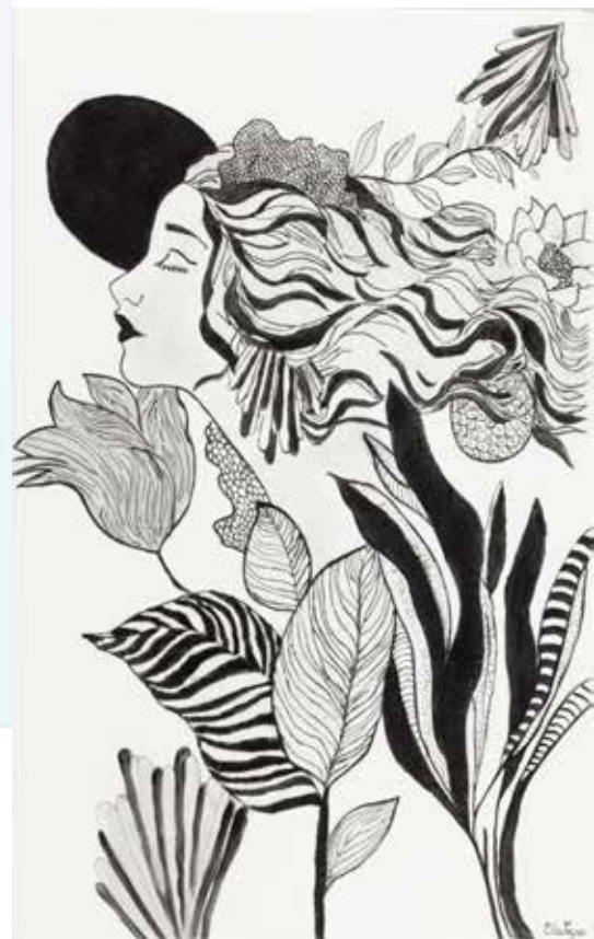
ODETE GONÇALVES MULHER Técnica mista s/ azulejo, 2022