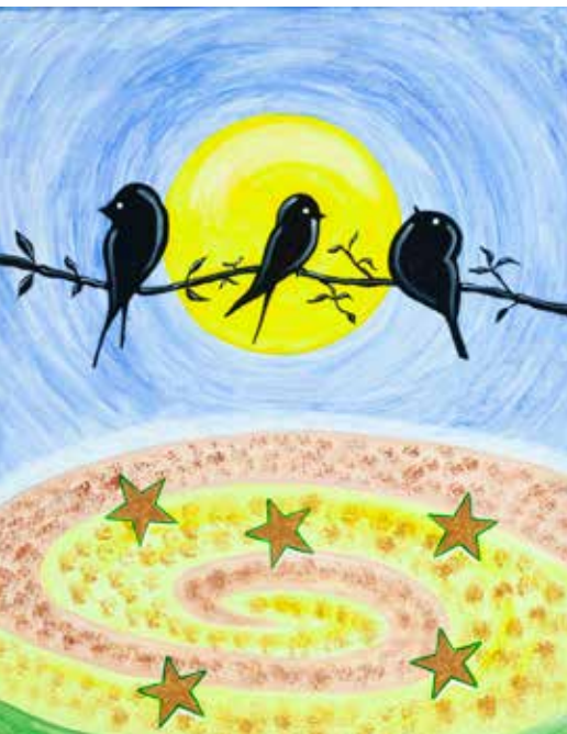
DOMINGOS NOGUEIRA S/ TÍTULO acrílico s/ tela, s/ data 300€