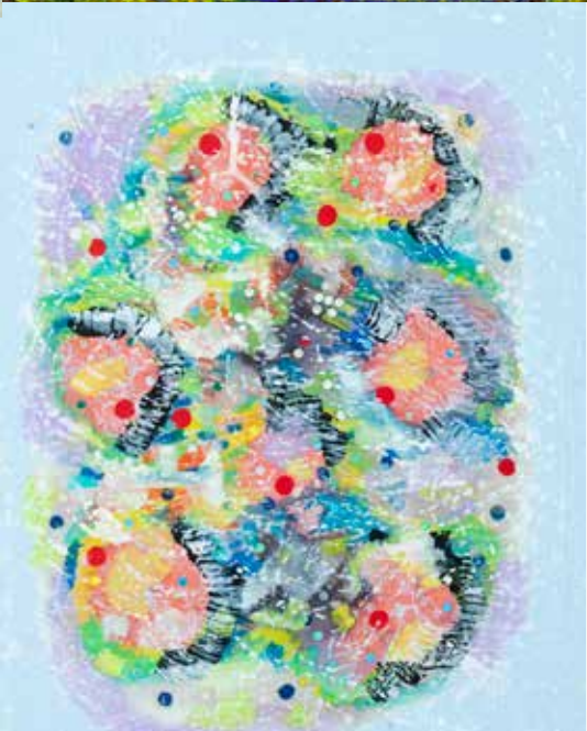
SARA ANTUNES FLORESTA INTERIOR técnica mista s/ papel, 2022 250€