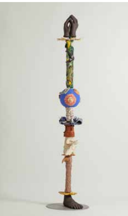
CARLOS PÉ-LEVE S/ TÍTULO cerâmica e vidro, s/ data 650€