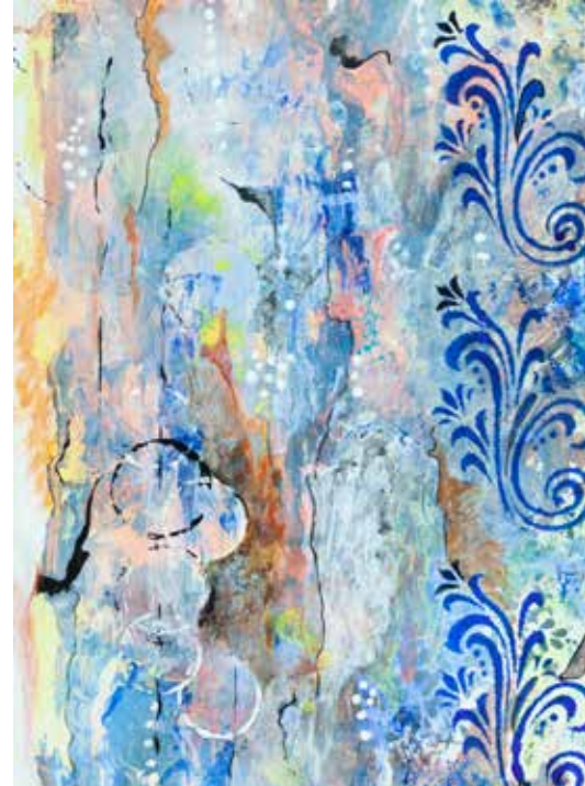
LISETE EMÍDIO S/ TÍTULO acrílico s/ tela, 2022 350€