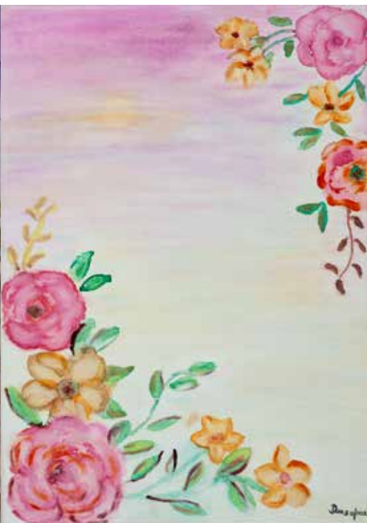
ILDA DEUS / «DEUSA» BOUQUET DO MEU CENTENÁRIO ecolines s/ tela, 2022 300€