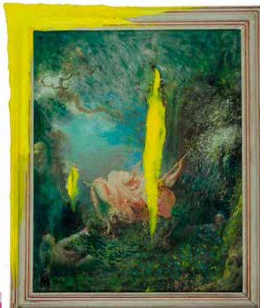
GRAÇA ANTUNES FLORESTA #BALANÇA acrílico sobre tela impressa e colagem, 2022 800€