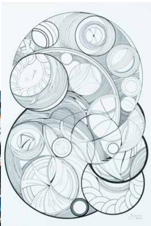
ISABEL CORREIA S/ TÍTULO tinta da china s/ papel, 2022 300€